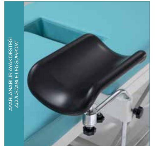
AYARLANABİLİR AYAK DESTEĞİ ADJUSTABLE LEG SUPPORT