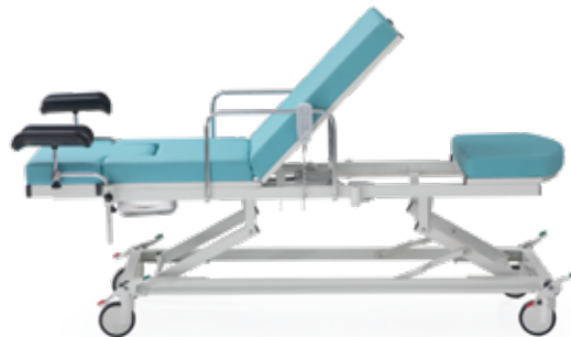
Sirt Hareketi / Backrest