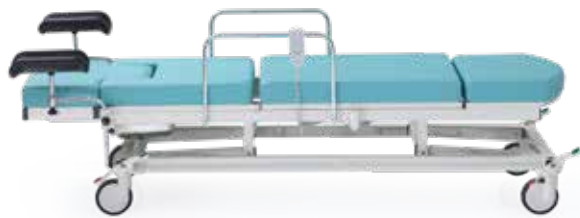
Yükseklik / High Low