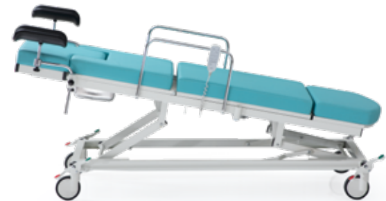
Düz Trendelenburg / Trendelenburg