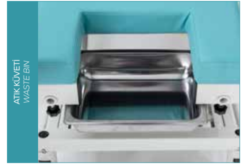
ATIK KÜVETİ WASTE BIN