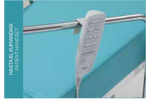
HASTA EL KUMANDASI PATIENT HANDSET