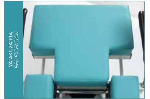
YATAK UZATMA BED EXTENTION